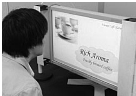
「嗅覚ディスプレイ」という そうち